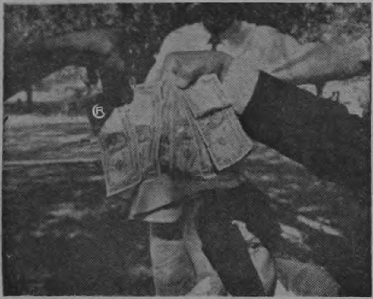
Todos los billetes de moneda americana están siendo sellados por los panameños con leyendas ofensivas contra los norteamericanos. "Yankee asesino vete" dicen esas leyendas. (Reportaje gráfico en Pág. 4)

El gobierno de Chiari pidió al de Costa Rica que se haga cargo de sus asuntos en Washington y pidió al gobierno norteamericano que retire su personal de Panamá. (TEXTO EN PAGINA 10)