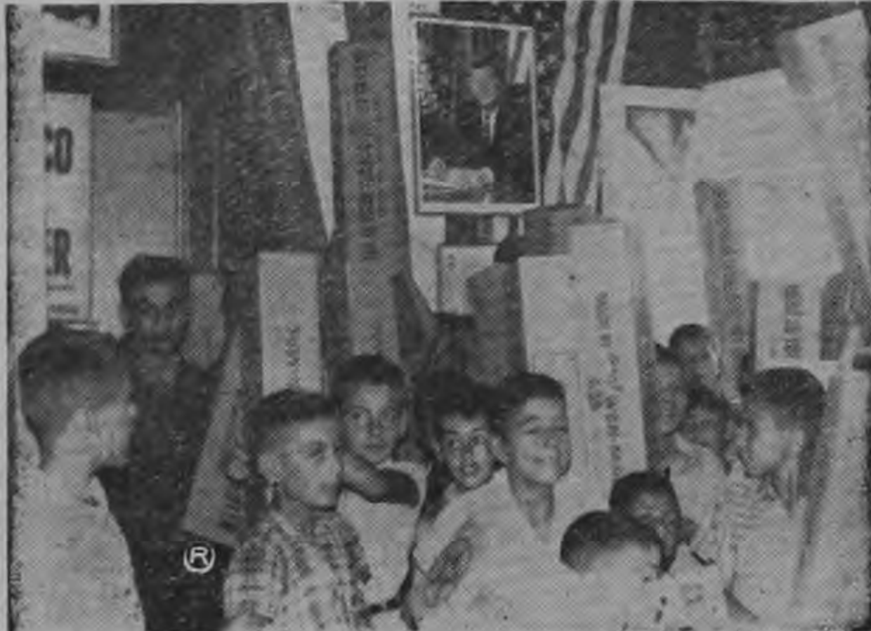
El Centro Cultural J. F. Kennedy obsequió valiosos juguetes a los niños pobres de Turrialba por cortesía de Texaco en días pasados. La foto deja constancia gráfica de la alegría de los niños ante el excelente regalo.

Finaliza diciendo el Dr. Valladares: La alteración de precios en la libra de café en los Estados Unidos, es producto de un juego de bolsa por parte de firmas internacionales dedicadas a tostar café, y a agenciar dinero mediante el daño a los productores y países cafetaleros. El alza de dinero, tiende a contrarrestar los fines del convenio pero es un deber, informar que todo es maniobra de especuladores y no de deficiencias del Convenio Internacional del Grano.