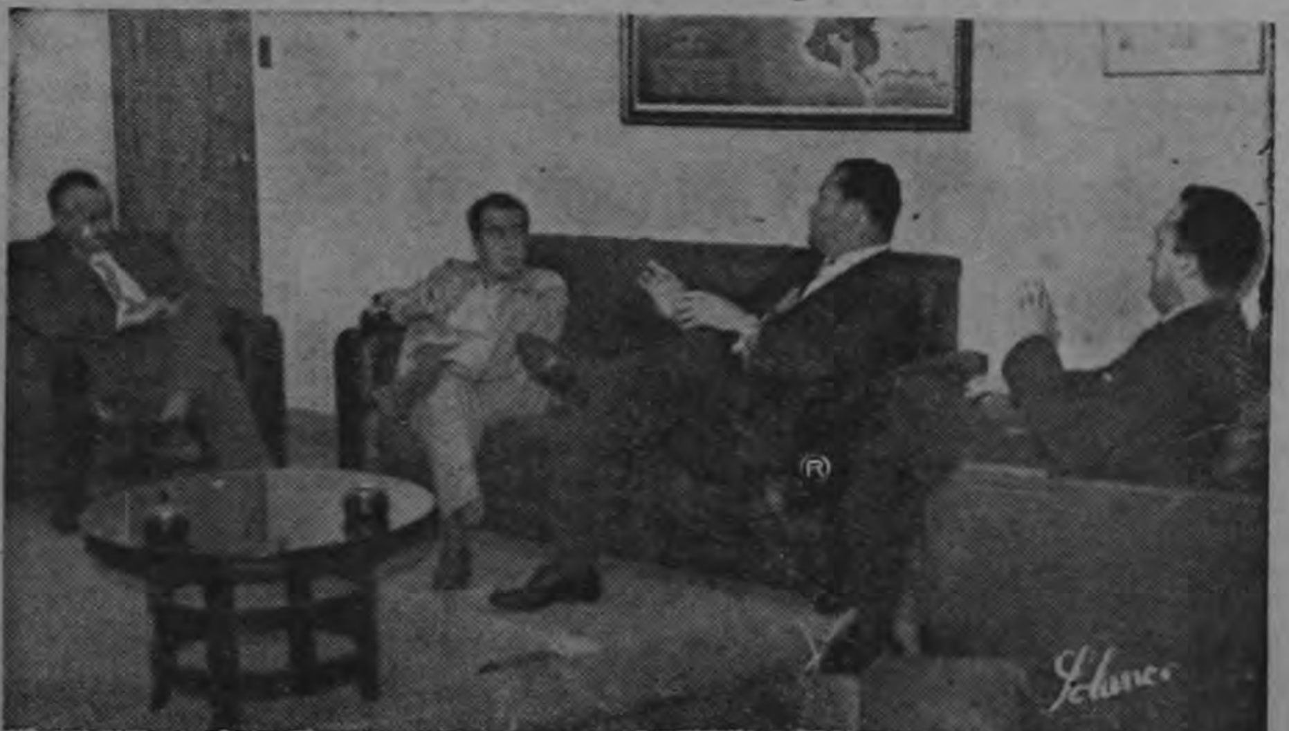
En la reunión efectuada ayer en la Cámara de Agricultura conjunta con personeros del Consejo de la Producción, se trató nuevamente sobre el incremento a la producción algodonera en Costa Rica, aprovechando el préstamo que el Banco Central dio a los productores por once millones de colones, con facilidades de pago. Aparecen en la

La Cámara de Cafetaleros solicitó al Gerente del Banco Central de Costa Rica disponer que el primero de febrero se inicie la primera etapa de financiación del café en las zonas bajas y el quince del mismo mes en el resto del país. Considera la Cámara que esas fechas son las que aconsejan las circunstancias actuales en vista de que para las zonas no comprendidas en esa denominación, la preparación de la cosecha se ha adelantado este año más de lo normal. — (TEXTO EN PAGINA 15) —